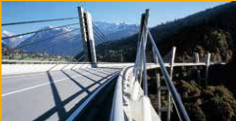
BETONSCHUTZ UND -INSTANDSETZUNG