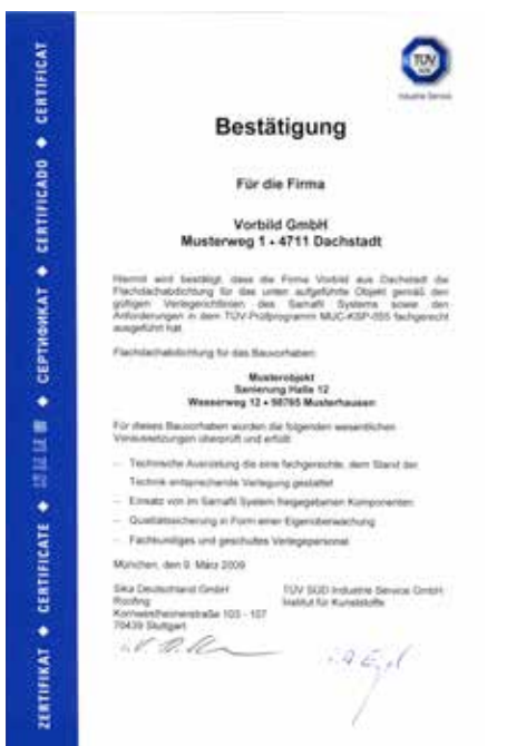
Bestätigung/Zertifikat des TÜV SÜD