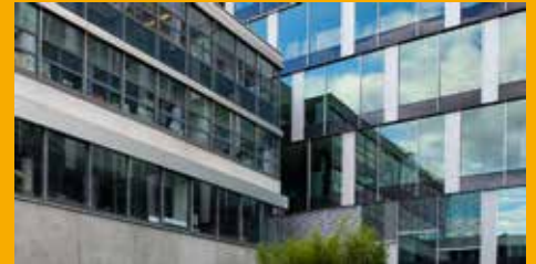
KLEBEN UND DICHTEN IM FASSADENBEREICH