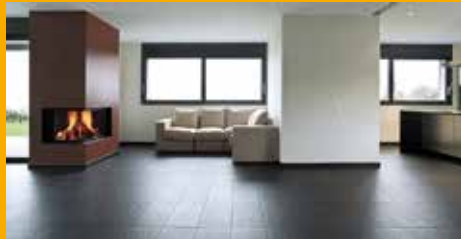
KLEBEN UND DICHTEN IM INNENAUSBAU