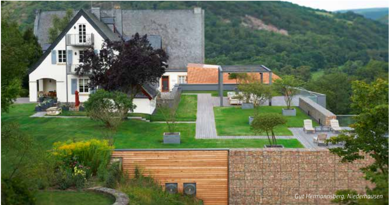
Gut Hermannsberg, Niederhausen

Bei einem Dachdeckerfachbetrieb mit Mitarbeitern, die erfolgreich an TÜV-SÜD-zertifizierten Verarbeiterschulungen teilgenommen haben, werden die Grundlagen geschaffen, um die Bauvorhaben nach dem TÜV-SÜD-zertifizierten Sarnafil® Flachdach-System auszuführen.